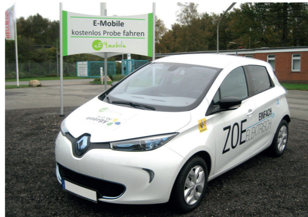
Kostenlos Probefahren auf dem GreenTEC Campus in Enge-Sande: z. B. der Renault ZOE.

Sie zweifeln noch, haben noch unzählige Fragen zum Thema E-Mobilität? Dann nehmen Sie bitte Kontakt zu uns auf – spätestens nach der ersten Probefahrt haben sich die ersten Fragen in Luft aufgelöst.