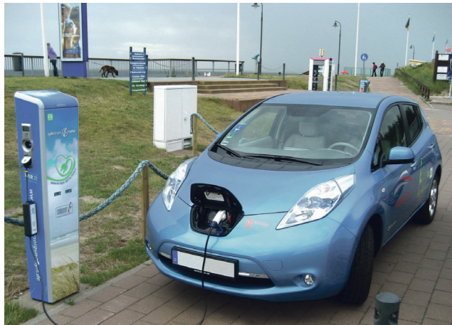
Einer von unseren Nissan LEAFs an der Stromtankstelle der Energieversorgung Sylt in Hörnum.

eE4mobile bietet supergünstige Konditionen durch Rahmenabkommen mit namhaften E-Mobile-Herstellern.