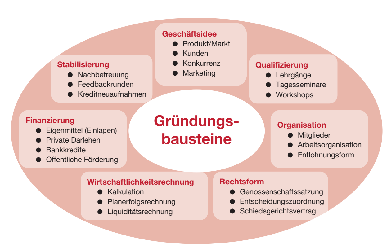
Abbildung 1: Wichtige Bausteine für die Gründung einer Energiegenossenschaft

Die genossenschaftliche Rechtsform eignet sich besonders für Photovoltaikanlagen in der Grössenordnung von ca. 30 kWp oder ca. 300 qm Dachfläche, bevorzugt auf Dächern von Schulen oder sonstigen öffentlichen Einrichtungen. Eine solche Grössenordnung bietet zumindest nach den Bestimmungen des Erneuerbaren-Energien-Gesetzes (EEG) die optimale finanzielle Förderung. Ausserdem existieren Dächer dieser Grösse nicht so selten. Gleichzeitig kommen bei Dachflächen dieser Grössenordnung die wirtschaftlichen Vorteile einer Grossanlage bereits zum Tragen. Grob vereinfacht lässt sich für Anfang 2010