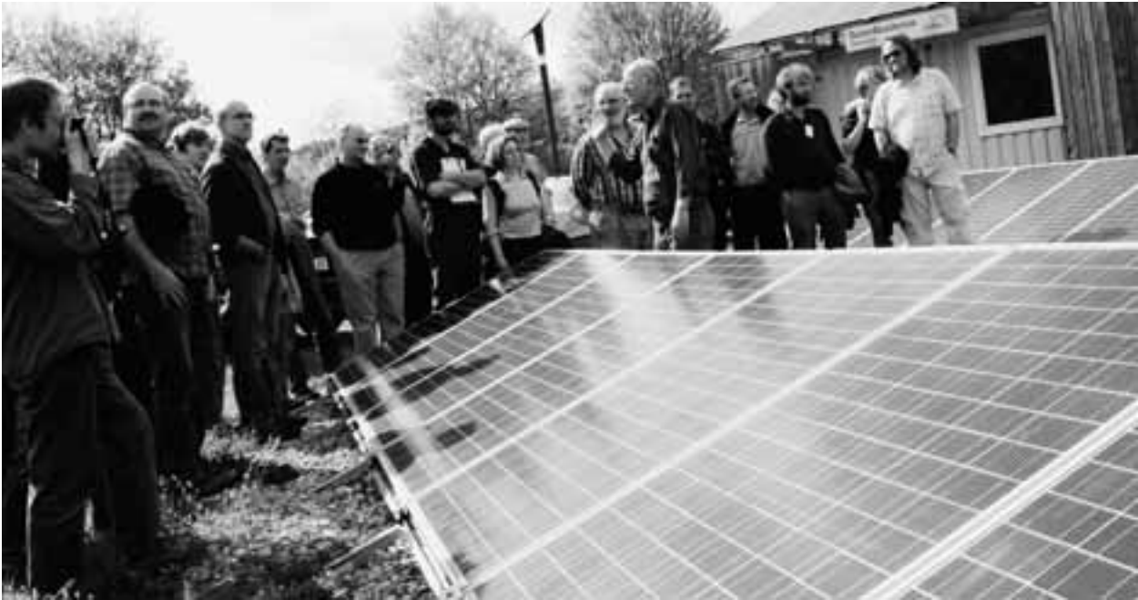
Abbildung 3: Exkursionen mit konkreten Projektbesichtigungen sind Teil der Qualifizierung